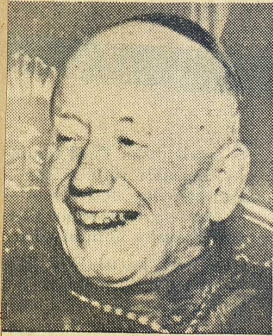
till vänster) och Saliège.

Frankrike, i tidningar och tidsskrifter av skilda politiska och religiösa riktningar. De politiska tvisterna har under några veckor trätt i bakgrunden för denna konflikt, som till sina omedelbara följder är så begränsad. Debatten om arbetarpräster ger åtskilligt till belysning av dagens Frankrike. HERBERT TINGSTEN