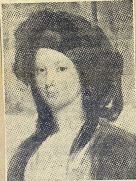
Juliette Drouet var den främsta av Hugos älskarinnor; här i ett rollporträtt som furstinnan Négroni i Hugos drama "Lucrece Borgia".

portvakt, "magnifikt högtidlig, tråkig och stortalig, som liknade Hugo så mycket att alla människor blev lurade". Men med förlöjligandet förenas nästan alltid beundran för diktargenet, även hos Sainte-Beuve. På frågan om vem som var Frankrikes störste diktare svarade en gång André Gide: "Victor Hugo, tyvärr." Det är typiskt.