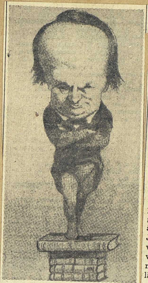
Hugo i samtida karikatyr.

nalism, människornas naturliga godhet, känslans rätt, samhällets och de styrandes onda tendenser. 600.000 samlades vid hans åttiårsdag; två miljoner följde honom till graven i Panthéon på våren 1885.