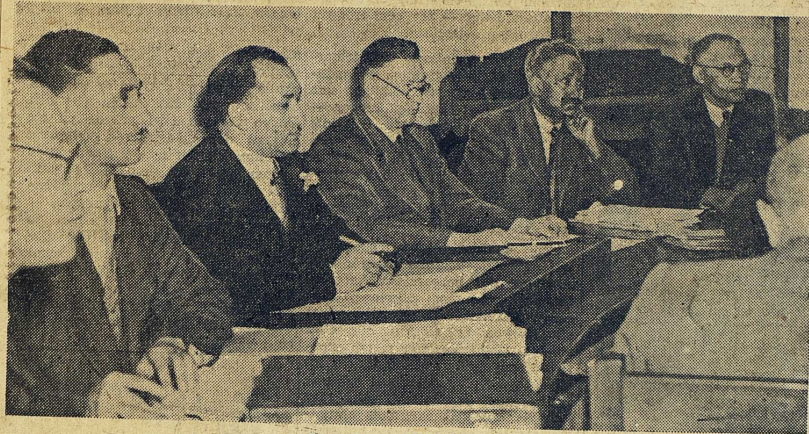
Färgade av skilda typer.

I DET SENASTE häftet av Sydafrikanska unionens månatliga statistiska redogörelse finns en beräkning av folkmängden för år 1953. Den totala siffran är 13,2 miljoner. Man skiljer på fyra "raser". De vitas antal är 2,8 miljoner, de inföddas (natives) 8,8, asiaternas 0,4, de färgades (coloured)