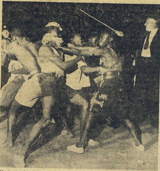
Varje söndagskväll anordnas i Pretoria under polisens överinseende slagmål mellan infödda för att ge dem tillfälle att "leva ut sina djuriska drifter". Mannen med käppen är ett polisbesäl.

Främst är det här fråga om de vitas hållning till de andra, undertryckta folkgrupperna. "Hur länge stannar ni i Sydafrika?" "Sex veckor." Svaret utlöser kritik eller hån: "Tror ni er kunna lära något om våra rasfrågor på sex veckor? Man måste bo här många år, ja, hela sitt liv, för att begripa saken. Vi känner de infödda (indierna, de färgade) och hur de skall behandlas. Hur skulle ni på några veckor kunna lära er vad vi behövt århundraden för att förstå?" Detta resonemang, som ofta förs även av nyinflyttade och personer som här en eller två generationer bakom sig i Sydafrika, går det inte att vederlägga med hänvisning till att det finns en väldig litteratur kring rasproblemen och att man där möter de mest stridiga åsikter. Majoritetens åsikt är klar och auktoritativ; vad några europeiskt påverkade särlingar skrivit är ingenting att bry sig om. Att förstå rasfrågan är helt enkelt att godta den härskande meningen; alla studier som inte leder dit är meningslösa eller skadliga. Många antyder att det är fräckt och förväget för en utlänning att alls söka sätta sig in