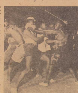
Vår sändningskällan i Pretoria under politens övervakning.

INGENSTADES har jag som i Sydafrika misshandlats som en hyrdhund, konfiska, aggressivt, självaktlös ären då de är lösligt oförståliga. Och föregående har jag hos både och obildade följt dem i förtroende om jag med en sådan skyddsmur av självakt, ömksamhet och en viss tillit till dem.