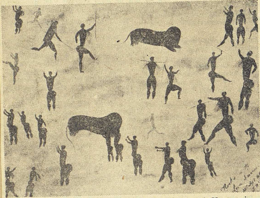
Grottmålning från Camp Siding vid Queenstown i Kapprovinsen, utförd av buschmän eller deras imitatorer (bottentotter eller bantus).