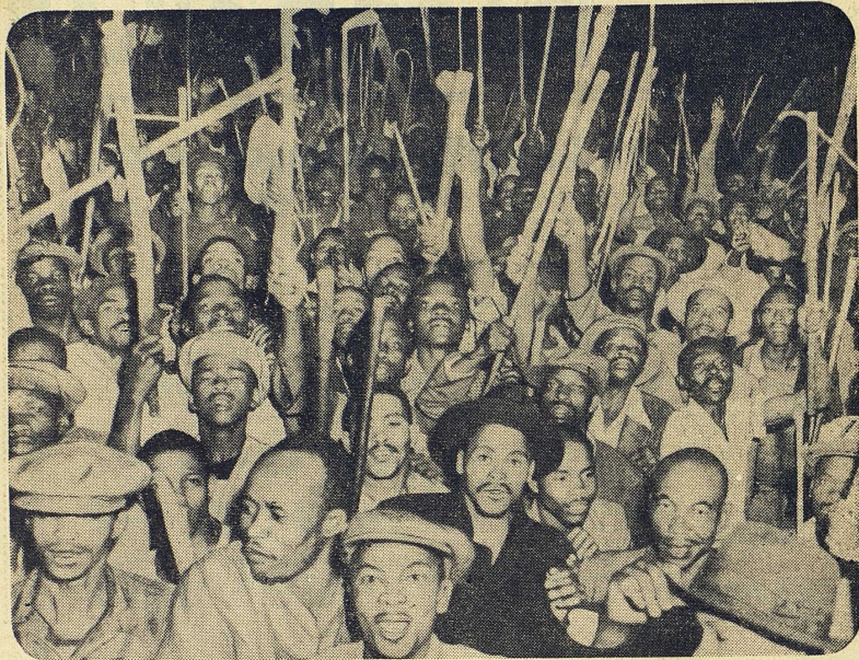
Förbittrade infödda demonstrerar i Johannesburg mot raslagarna; de svartas stora motståndskampanj ökade de vitas fruktan för att förlora väldet i Sydafrika.

Fruktan för att förlora makten och den privilegierade ställningen påverkar kanske mer än något annat de vitas raspolitik i Sydafrika, framhåller Herbert Tingsten, som i dagens artikel på kultursidan analyserar de vitas rasfödomar. Det centrala är känslan av intellektuell och mo-