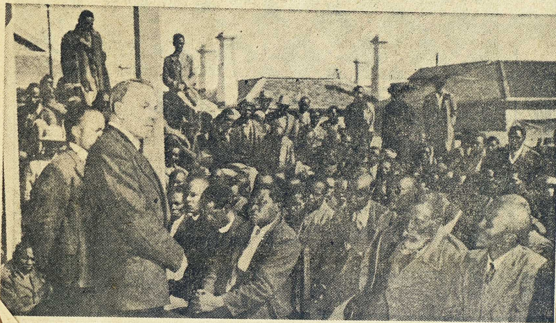
Eiselen, infödingsministeriets drivande kraft, talar till en samling representanter för de infödda.

MALANS NATIONALISM innebär ingenting nytt, säger många, både kritiker och anhängare. Sydafrikansk politik har alltid, om också med växlande skärpa, gått ut på de vitas väld och särskiljande av vita och icke-vita; Malan fortsätter på den vägen med större konsekvens eller, om man så vill, större hänsynslöshet än sina föregångare. Från andra kommer motsatta påståenden. Malan har uppgivit den politik från fall till fall som kunde ha förbättrat förhållandet mellan raserna, säger en del motståndare; för första gången har rasfanatismen fått ledningen. Det är riktigt, säger ivriga anhängare, såtillvida som nationalismen innebär en klar linje och stöder sig på en utformad ideologi. Ylligt sett är det här fråga om en skärpning av förtrycket och segregationen; i grunden förbereds en avspänning i stor stil.