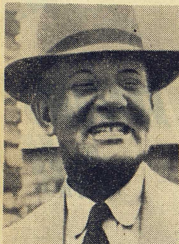
Dr J. S. Moroka, ordförande i Afrikanska nationella kongressen, under motståndskampanjen.

Hur är känslan bland de svarta som över huvud har någon uppfattning om problemet? Av samtal med ett antal bildade negrer och av upplysningar i andra hand fick jag intrycket att möjligheter till en uppgörelse utan våldsam konflikt ännu finns. De bildade svarta betraktar, hur mycket de än avskyr regimen, den vita kulturen som överlägsen; tanken på självstyrande negerområden avvisas inte bara därför att den är praktiskt ogenomförbar, utan