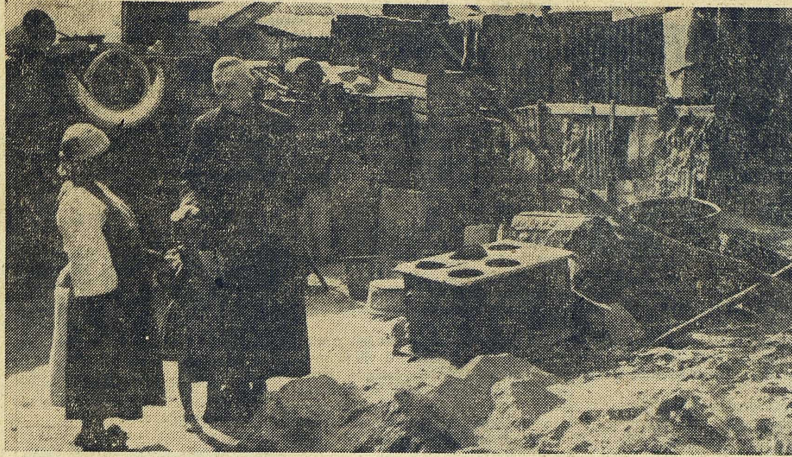
Anglikanen fader Trevor Huddleston besöker svarta skyddslingar.

SYDAFRIKA kallas kristet. Det är befogat från kvantitativ synpunkt: det överväldigande flertalet vita och färgade och en majoritet av de svarta tillhör kristna samfund. Det är också befogat med tanke på den inom den vita härskarklassen rådande ideologin. Man talar ständigt om den kristna civilisationen i Sydafrika; på ett sätt som hos oss är okänt åberopar statsmännen Gud, Bibeln och Kristi lära. Men detta slags enighet hindrar inte motsättningar och konflikter. Gud är garant för apartheid, och man hänvisar till hans ord i kampen mot apartheid; varje mening i rasfrågan stöds med bibelcitat och bibeltolkningar. På ett sätt som knappast har motstycke i modern politik är debatten kring de centrala problemen präglad av religiösa meningsbrytningar.