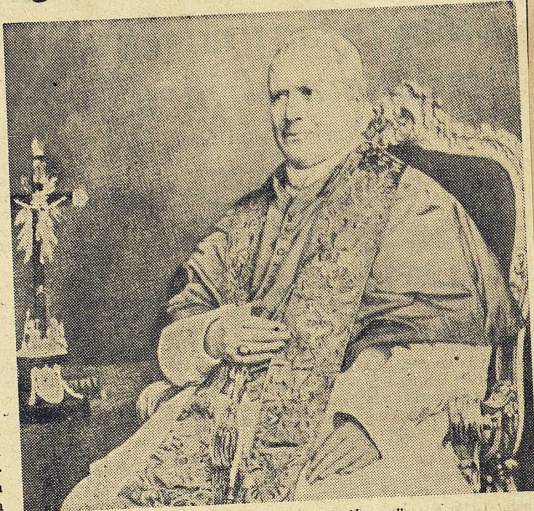
Pius IX som "fånge i Vatikanen".

Den TRADITIONELLA bilden av Pius IX (påve 1846—1878) utanför de troende katolikernas krets är inte smickrande. Då kardinalen greve Mastai-Ferretti valdes till påve och antog namnet Pius var han föga känd, men redan efter en kort tid blev han ryktbar för sina liberala reformer. Det var inte religiösa, utan politiska förändringar det här gällde; som härskare i Kyrkostaten — en stor del av Mellanitalien med 3 miljoner invånare — genomförde påven ett slags konstitutionell monarki, med representation, moderniserad förvaltning och begränsning av det gamla polisväldet. Inom den rörelse för Italiens enhet som företrädde liberalismens kombination av demokrati och nationell självständighet talade man rent av om påven som blivande president i en italiensk förbundsrepublik. Men snart blev det brytning mellan påven och de revolutionära tendenserna; Pius ville inte delta i kriget mot Österrike och sade nej till de radikala krav i Rom och Kyrkostaten. På hösten 1848 blev påven tvungen att förklädd fly till det reaktionära Neapel, och den romerska republiken utropades. De italienska upprorsrörelserna blev emellertid denna gång snabbt krossade, i huvudsak av Österrike, i Rom av den franska republiken under den blivande Napoleon III. Efter dessa erfarenheter blev Pius, som först 1850 kom tillbaka till Rom, reaktionär