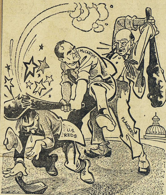
McCarthy, i full färd med att krossa den amerikanska kommunismen, blir lömskt angripen bakifrån av den rasande senator Flanders — så framställs i den press som stöder häxjakten det faktum att Flanders kritiserat McCarthy's metoder. Teckningen hämtad ur "Know Your Enemy".

En överväldigande opinion torde stå bakom de mildare aktionerna, såsom avstängandet av kommunister från ämbeten och de på lojaliteten inriktade undersökningar som i detta samband äger rum. I övrigt finner man att en del riktningar och organisationer i viss omfattning stödjer eller