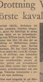
Lord Melbourne 1834.

Inte alltid är kunskap en lutt böda. BARBARA HANVELL