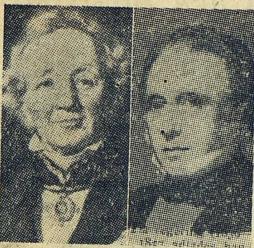
Leopold von Ranke (till vänster) och Thomas Macaulay, två av de historiker vilkas idéer och metoder analyseras i det här anmälda arbetet av Pieter Geyl.

I det inledande kapitlet behandlas Rankes och hans efterföljares historicism. Geyl framhåller hur lätt försöken att klargöra och förstå "vad som egentligen skett"