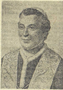
Pius IX fördömde i sin "Syllabus" 1864 "framsteget, liberalismen och den moderna civilisationen".

Tanken på religiös enhet är ursprunget till försöken att säkra freden genom en internationell rättsorganisation. Idén om den enskilda människans andliga värde ligger bakom utvecklingen häm mot individualism, politisk frihet och demokrati. Den kristna kärlekstanken har steg för steg lett till känslan av social solidaritet och därmed till sociala reformer, den har till och med varit den ytterst drivande kraften i socialistiska och kommunistiska ideologier. Vid en viss grad av teknisk och intellektuell utveckling har de kristna idéerna — likt