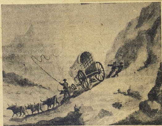
Oxvagnen över Drakbergen (i modern sydafrikansk framställning).

Voortrekkers kände sig som bärare av en "vit, kristlig kultur", men det folk de kom från hade i stort sett stått vid sidan av europeisk debatt och ägde, utanför den reformerta kyrkan med dess starka traditionalism, inte någon intellektuell elit. De amerikanska och franska revolutionerna hade gått denna lilla folkspillra förbi. Alla uppgifter tyder på att knappast någon annan bok än bibeln medfördes på de oxvagnar som blivit symbolen för det stora ut-