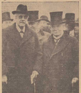
Balfour (till vänster) och Lloyd George vid tiden för Balfour-deklarationen.