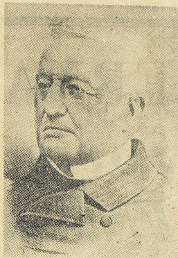
ADOLPHE THIERS. Statschef 1871—1873.

Den 19 juli 1870 började det fransk-tyska kriget genom fransk krigsförklaring. En månad senare, efter en obruten serie av nederlag, inneslöts marskalk Bazaines armé i Metz; den 2 september kapitulerade den andra huvudarmén, med kejsaren och MacMahon, vid Sedan. Två dagar därefter föll kejsardömet utan svärds slag genom ett upplopp i Paris. Ehuru den med allmän rösträtt valda representationen huvudsakligen bestod av bonapartister, övertogs makten av en regering bestående av motståndare till kejsardömet, bland dem främst parisiska republikaner, och republiken utropades. Den nya regimen erkändes i provinserna utan nämnvärt motstånd, om också utan entusiasm. Än en gång — för vilken gång i ordningen sedan den stora revolutionen? — hade en parisisk statskupp blivit bestämmande för statsstyrelsen; Frankrike böjde sig för den ordning som proklamerades i telegrammen från huvudstaden.