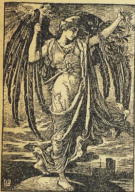
KOMMUNENS GENIUS. Teckning av Walter Crane.