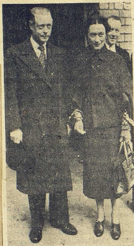
Hertigparet av Windsor