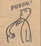
Om man lässt giletstenen är en lopp och det är mest.