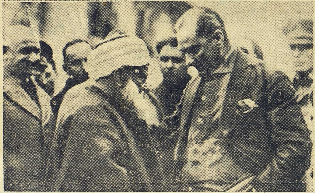
Kemal bekantar sig med en gammal gubbe under en rundresa i landet på 1930-talet.