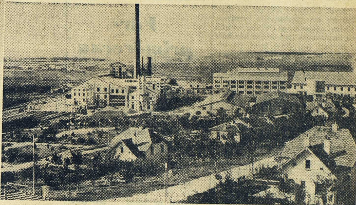
Modern sockerfabrik i Alpullu med villabebyggelse omkring.

I NDUSTRI och gruvarbete var före Atatürks regim praktiskt taget obefintliga i Turkiet, delvis på grund av de fördrag med stormakterna (kapitulationerna) som hindrade turkarna att införa skyddstullar och tenderade att ge landets ekonomi en rent kolonial karaktär. I Ata-