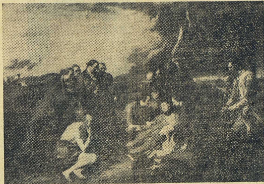
"Wolfe's död" av historiemålaren B. West; i National Gallery of Canada.

Och utan tvivel är slaget på Abrahams slätter utanför Quebec ett av de mest vykorts-mässigt tjugande i historien. William Pitt hade givit ny kraft åt den engelska insatsen i det sjuåriga kriget: ett av hans djärvaste initiativ var att sända den 32-årige James Wolfe i spetsen för en stor expedition till Amerika för att erövra Nya Frankrike. I slutet av juni 1759 låg den brittiska flottan utanför det starkt befästa Quebec, där blomman av den lilla franska armén i Kanada under general Montcalm — segerrik i en rad strider under de föregående åren — samlats för att möta angreppet. Belägringen gick inte framåt, ett anfall i stor stil i slutet av juli misslyckades totalt. Wolfe, dödssjuk och övertygad om att belägringens upphävande — ofrånkomligt då isen kom i oktober eller november — skulle göra slut