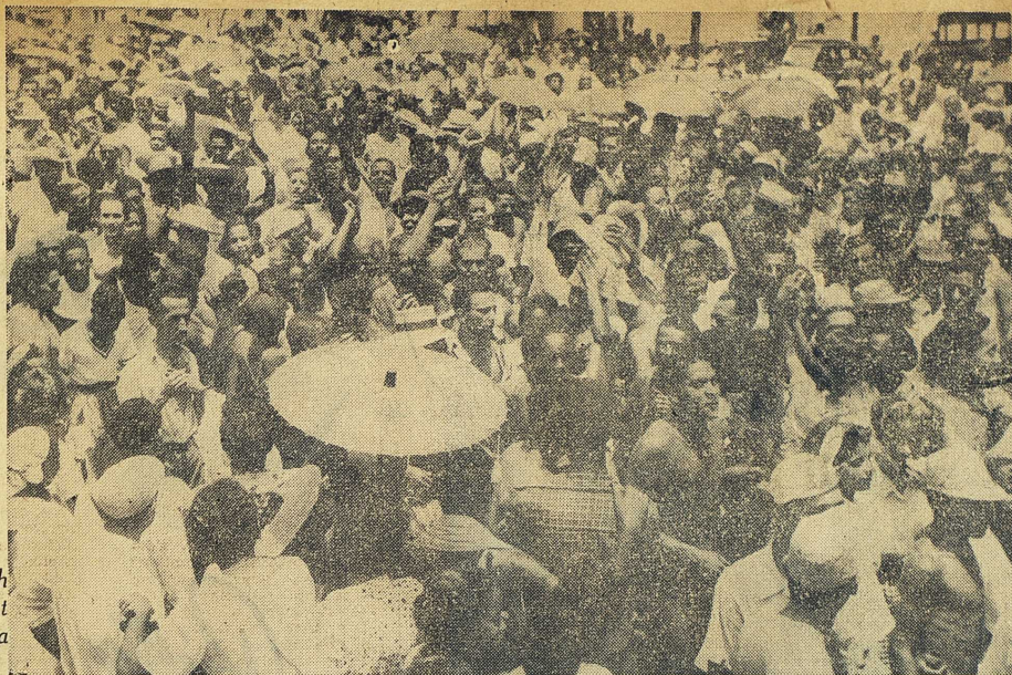
Vitt, svart och blandat i vimlet på en av Rios fina badplatser.