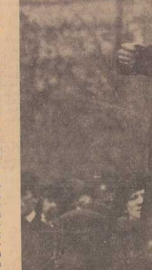
Per Albin Hansson från 1918 fram i bakgrunden på Nora-baleten om lösnedgåendet.

ligen ges är en övervägande redogörelse för svensk politik och svensk socialdemokrati, med i framställningen iakttagande av notiser om Hanssons ställningssätt och inställning till det blivt möjligt att skriva över 400 sidor om tiden före socialdemokratiska ministären bildande, och den ojämförligt viktigaste delen av Hanssons verkshet faller alltså utanför. Boken är byggd på rejält forskningar, buren av en bred vana till klarhet och fullständighet. Författaren är inte besvärad av trångt perspektiv, det framgår särskilt av hur utförligt och uppskattande han redogör för samarbetet mellan liberaler och socialister i kampen för demokratin. Boken är vässerligt stor, men tilltänkt och de färliga illustrationerna är väl valda. Och likväl måste tyvärr sägas att arbetet i det hela är en missräkning; författaren har inte varit vuxen sin uppgift. Om någon biograf över Per Albin Hansson kan man knappast mest tala. Vad som huvudsak-