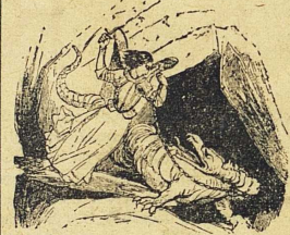
Engeln kastar den fjättrade draken i avgrunden.

Därmed är inte sagt att kristendomens inflytande på framstegstankens utformning förnekats. Tvärtom, en rad historiker, såsom Carl Becker och Richard Niebuhr, betonar att den världsliga framstegstanken är byggd på kristen förebild, att upplysningsfilosoferna "för-