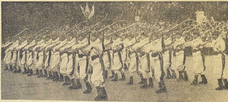
Skidtrupp i den stora militärparaden på Argentinas oavhängighetsdag, den 9 juli.

"GENERAL PERON framlägger inte abstrakta idéer, utan följer alltid handlingens väg... Hans doktrin är grundad på handling och är på en gång en originell teori och ett praktiskt krav." Så heter det i förordet till en officiell upplaga av Peróns tal. Det är en synpunkt som vi alltför väl känner från nazismen och än mer från fascismen. Ledaren representerar handlingen och livet självt i dess rikedom och växling. Hans syften kan inte klarläggas genom "abstrakta" och "teoretiska" utläggningar. Det väsentliga är hans oförläpna person. "Jag tänker ibland att president Perón upphört att vara en man som andra män — att han snarare är ett ideal som blivit kött och blod", skriver fru Perón, den främsta av generalens lovprisare. "Perón skall alltid stå för sitt folk som ett ideal, en fana, en fyrbåk, ja, som en stjärna som visar vägen genom natten till den slutliga segern"