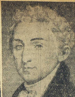
President JAMES MONROE, som gav Monroe- doktrinen av 1823 dess namn.