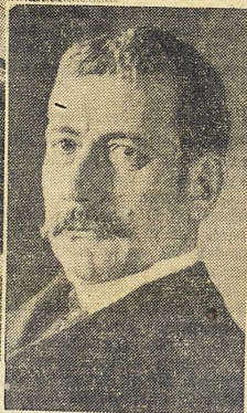
Till höger Roosevelts utrikesminister Elihu Root.

nerterna. Vissa förhållanden, som bortskymms av det gemensamma namnet och av föreställningen att världsdelar skall bilda en enhet, gör den begränsade kontakten naturlig. Man glömmer lätt att Sydatlanten länge varit en brygga snarare än en klyfta och att stora delar av Amerika ligger närmare Europa än avlägsna platser inom den egna världsdelen: avståndet mellan Washington och Moskva är mindre än mellan Washington och Buenos Aires, Nordamerikas centrum är närmare alla europeiska huvudstäder (utom Aten) än Rio de Janeiro, före Panamakaneln reste man lika snabbt från London som från New York till Sydamerikas västkust. Vidare var USA länge liksom Latinamerika ett kapitalfattigt land, med import av industri-