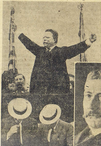
THEODORE ROOSEVELT i aktion.

I slutet av 1800-talet inträder på en gång mera intima och mera spända förbindelser mellan USA och dess världsdelsgrannar i söder. USA:s industriella och finansiella expansion, som gör unionen till Englands och Tysklands konkurrent om exporten till och investeringarna i det latinska Amerika, kan kanske betecknas som en grundläggande orsak; tendenserna till imperialism omkring sekelskiftet, betinga-