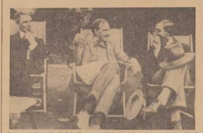
Bertrand Russell, J. M. Keynes o. Lytton Strachey, omkring 1917.