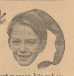
Klart morsan köper hem