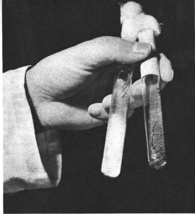
Tillgången på penicillin i Sverige är ytterst knapp, varför försök ha gjorts med framställning här. Dessa provrör innehålla stammar av penicillinbildande mögelsvamp.