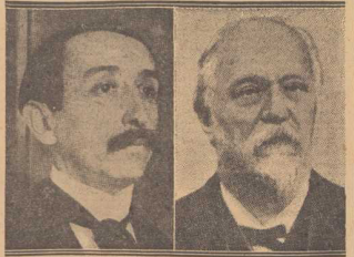
Maurice Barrés (till vänster) och George Sorel.

Den moderna antiintellektualismen franskt som en reaktion mot den rationalistiska uppfattningen... Maurice Barrés (till vänster) och George Sorel.