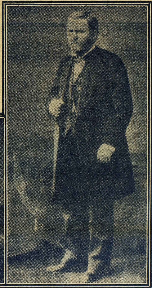
Till vänster. Washington vid 60 års ålder; därbredd general Grant, fotograferad under hans första presidentår.

Den för närvarande så flitigt idkade biograferingskonst, som söker förena vetenskapens exakthet med diktens omedelbara, fullständiga inlevelse — man tänker främst på Lytton Strachey, Maurois och, på ett lägre plan, Emil Ludwig — har även i Amerika hunnit framgångsrika utövare. Så har, för att nämna det kanske förnämsta exemplet, den svensk-amerikanske diktaren Carl Sandburg givit en sug-